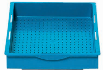
81711 Bac de mouillage