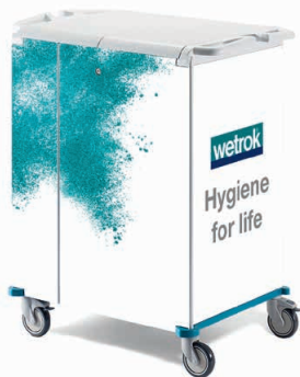
80975 KeyCar Medium PE