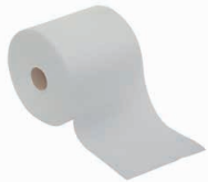
82525 Masslinn 2000 en rouleau