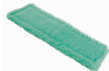
82531 Toison de dépoussiérage 1600