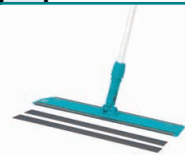
80532 Balit 560 avec bandes auto-agrippantes