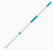
80413 Manche télescopique