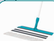
80517 Balit 560 avec semelle pour pad