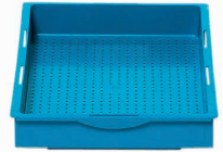
81711 Supporto per inumidire