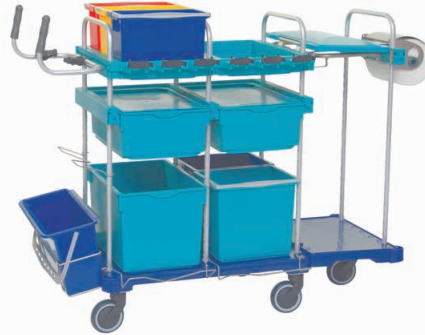
80770 SmartCar Competence WL2