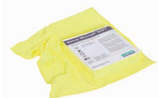
82145 Microwit SOFT giallo sul mobilio