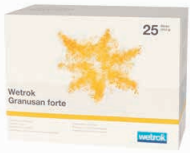
18760 Granusan forte