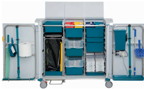
80975 KeyCar Medium PE