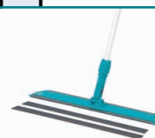
80532 Balit 560 con strisce in velcro