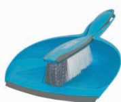
80290 Paletta e spazzola manuale