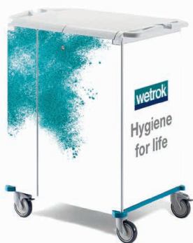
80975 KeyCar Medium PE