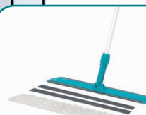
80517 Balit 560 con base pad