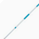
80413 Manico telescopico