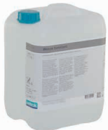
16550 Sintogard 10 l