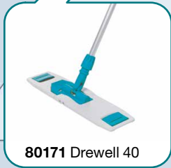
80171 Drewell 40