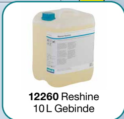
12260 Reshine 10L Gebinde