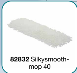
82832 Silkysmooth- mop 40