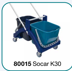
80015 Socar K30