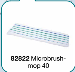
82822 Microbrush- mop 40