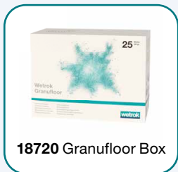
18720 Granufloor Box