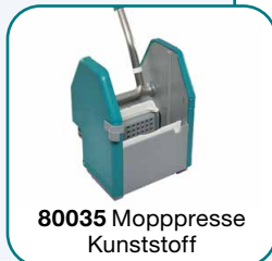
80035 Moppresse Kunststoff