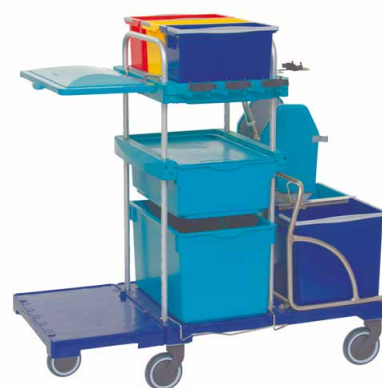
80769 SmartCar Allround GL1