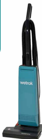
40010 Karpawel 36 Plus