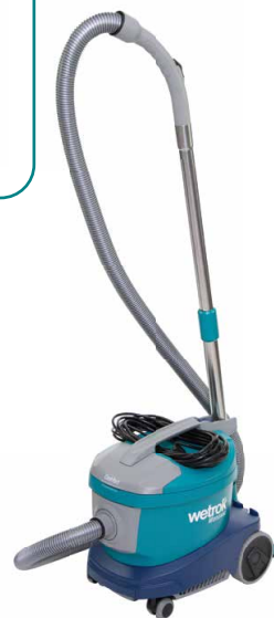
40710 Monovac Comfort 6