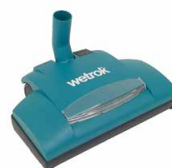
41614 Picojet M