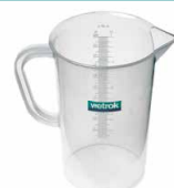
10733 Gobelet doseur PP 1 L