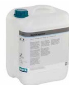
17500 Imprasol Bidon 10L