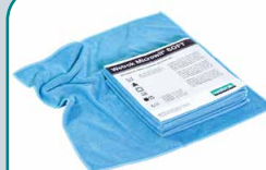
82142 Microwit SOFT bleu