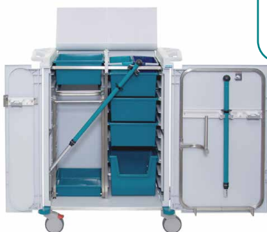
80975 KeyCar Medium PE