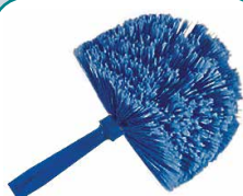
80276 Spazzola per soffitto