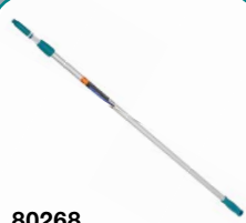
80268 Manico telescopico