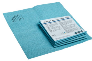
Microwit SHINE, blau (Art.-Nr. 82712)