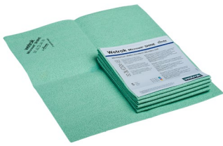
Microwit SHINE, grün (Art.-Nr. 82711)