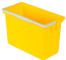
SmartCar Eimer S 8l (Art.-Nr. 81727)