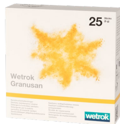
Granusan 1 × 25 Sticks (Art.-Nr. 18730)