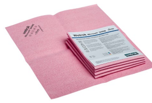
Microwit SHINE, rot (Art.-Nr. 82713)