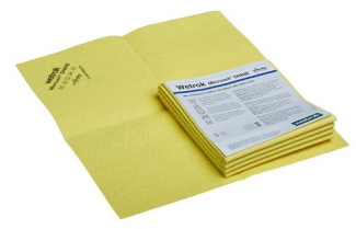
Microwit SHINE, gelb (Art.-Nr. 82714)